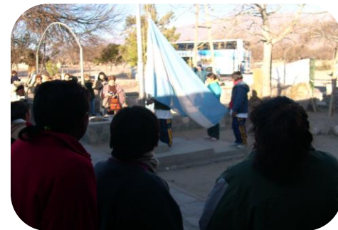
Dimensión institucional y comunitaria